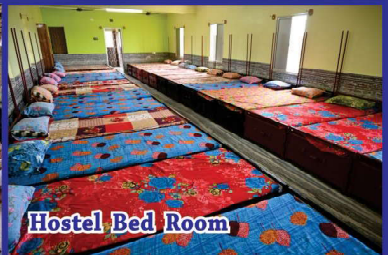
Hostel Bed Room