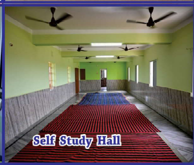
Self Study Hall