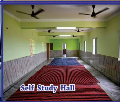
Self Study Hall