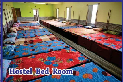
Hostel Bed Room