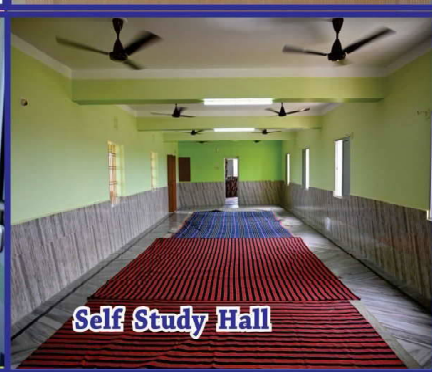
Self Study Hall